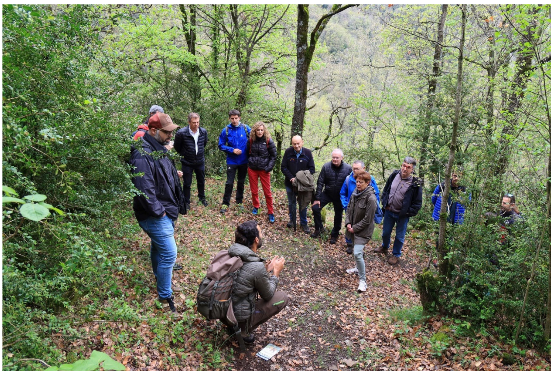
Caminada guiada fins al mirador de Beranui.