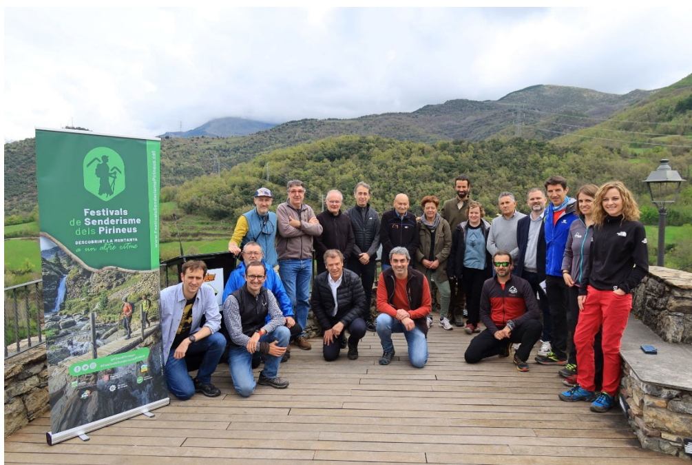
Un moment de la presentació, avui.

Els Festivals de Senderisme dels Pirineus arriben enguany a la setena edició celebrant-se, de nou, a les 11 comarques que integren la marca turística Pirineus (les comarques considerades de muntanya més l'Alt Empordà). Seran 12 esdeveniments programats de maig a octubre, habitualment els caps de setmana.